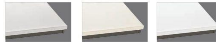
シルフィーグレー シルフィーベージュ ソルティホワイト

人造大理石トップを薄く仕上げ、インテリア性を追求しました。繊細なカラーコーディネートを実現する3カラーからお選びいただけます。