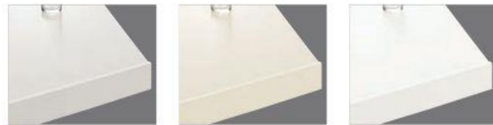
シルフィーグレー シルフィーベージュ シルフィーホワイト

より豊かな質感のワークトップがキッチン全体の風格を高め、あなたらしいひとときを味わえる上質な空間へ。