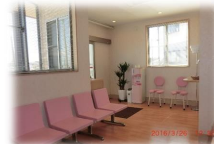
上の写真は院内の様子です。

今回は1月号でご紹介した『ラパン』さんのいとこさんが開業した地元浜崎のいけだ整骨院・鍼灸院のご紹介です。3年程前に須田建設で施工させていただいた明るい清潔な治療院です。腰痛・肩、首のこり・骨折・脱臼・捻挫・打撲等、あらゆる症状に対して適切な治療をさせていただきます。医療設備も充実しています。中でも『高気圧高濃度酸素カプセル』は有名アスリートも治療に取り入れた医療設備です。治療を受けながらの先生との会話も楽しみのひとつです。患者様の苦痛を少しでも早く取り除くことをモットーにした院長先生のお人柄が表れています。皆様もお困りの事がありましたら、ご相談してみはいかがでしょうか・・・。